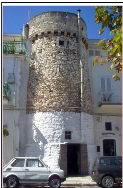
Fasano, torrione delle Fogge (Orubino)

(Fasciòne po fazansko ), občina z 39.431 preb., imenovano tudi mesto olja. Fasano je izpeljanka besede Faso, debel bel divji golob (je tudi v mestnem grbu), ki se je napajal v močvirju (t.i. fogge) in odprtih vodnjakih v okolici. Pvo naselje zgradijo leta 1088 ljudje, ki zapustijo bližnjo Egnazio, ki po padcu Zahodnega rimskega cesarstva (476) močno izgubi na svojem pomenu in je na koncu povsem opuščena. Od XIV. stol. je Fasano v fevdu Reda malteških vitezov . Leta 1678 premagajo Turške pirate (se pripoveduje, da se je na nebu pojavila Marija in v boju vodila domačine). V spomin na ta dan se, ob slavljenju zaščitnikov sv. Janeza Krstnika in sv. Marije iz Pozza Faceto , (pri kopanju vodnjaka v bližini (danes Pozzo Faceto) čudežno odkrijejo Marijino podobo, narisano na kamnu) pripravi še obnovitev tega zgodovinskega dogodka ( La Scamiciata ).