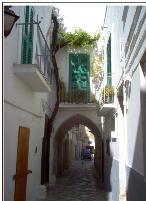
Fasano, via del Forno (Orubino)

Ko zapustimo Fasano, kolesarimo tudi mimo živaldkega vrta – safrija. Če bo čas, se bomo zapeljli med divjimi in eksotičnimi živalmi, endar ne s kolesom .