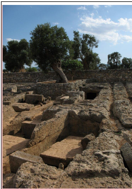
Egnazia, nekropole (Gianni Pofi)

Iz bronaste dobe si lahko ogledamo ostanek akropole, iz železne dobe ostanki obrambnega sistema, prebivališč in grobnic, iz helenškega (predrimskega) svetišča in grobnice, največ sledi pa pustijo Rimljani – trg (foro), Trajanova cesta, amfiteater, bazilika, netlakovane ceste, grobnic ipd. Precej ostalin je tudi mlajših, iz zgodnjekrščanskega obdobja – krstilnica, zgodnjekrščanska bazilika, škofovska bazilika in krstilnica. Vsekakor vedno ogleda. V bližini je tudi muzej