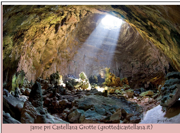
jame pri Castellana Grotte (grottedicastellana.it)

Po ogledu jam se zapeljemo v staro mestno jedro bližnje Castellane Grotte , Casteddóne po barijsko , mesta in občine z 20.000 prebivalci. Prvič je kot Castellano omenjeno v X. stol. in je dolgo podložno samostanu sv. Benedikta v Conversanu. Za ogled je zanimivo staro mestno jedro (razvijati se začne v XVI. stol. – značilne so dolge in vzporedne ulice), bogato s palačami iz XVII. in XVIII. stol., cerkev sv. Leona Velikega, cerkev sv. Roze, "umetnostna galerija" v cerkvi sv. Marije del Fato nella chiesa di Santa Maria del Suffragio ter številna vrata (Porta Gabella (1792), ime dobi po pšenici, ki jo vozijo skozi vrata, Porta Grande z obrambnim stolpom, Porta Nuova, Porta delle Olive (1700) in Porta Pèntimi (1700)) in obrambnih stolpov (Torre Nuova ali Castello (cilindrična utrdba iz XV. stol.) v srednjeveškem obzidju.