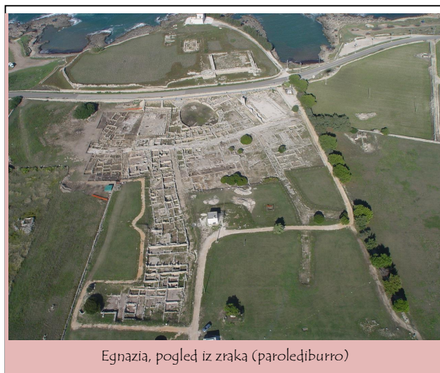
Egnazia, pogled iz zraka