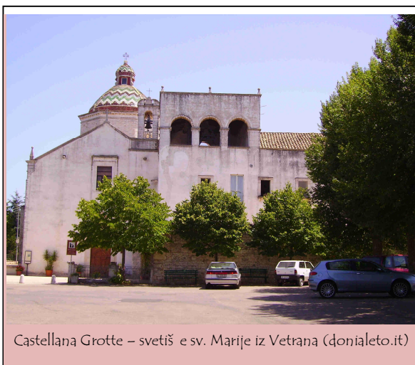
Castellana Grotte – svetišče sv. Marije iz Vetrana