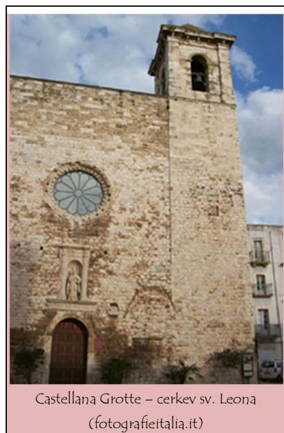
Castellana Grotte – cerkev sv. Leona